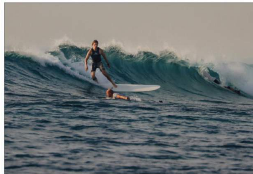
Journalisten fanget på en bølge på surfspottet Mull.