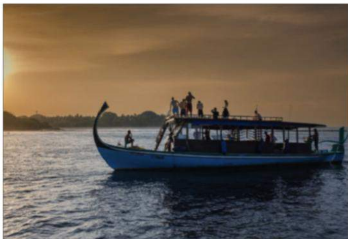
En dhony-følgébåd som vores i solnedgangen.