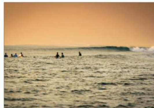
Flokken af danskere i vandet ved atollen Meemu på surfspottet Mull.