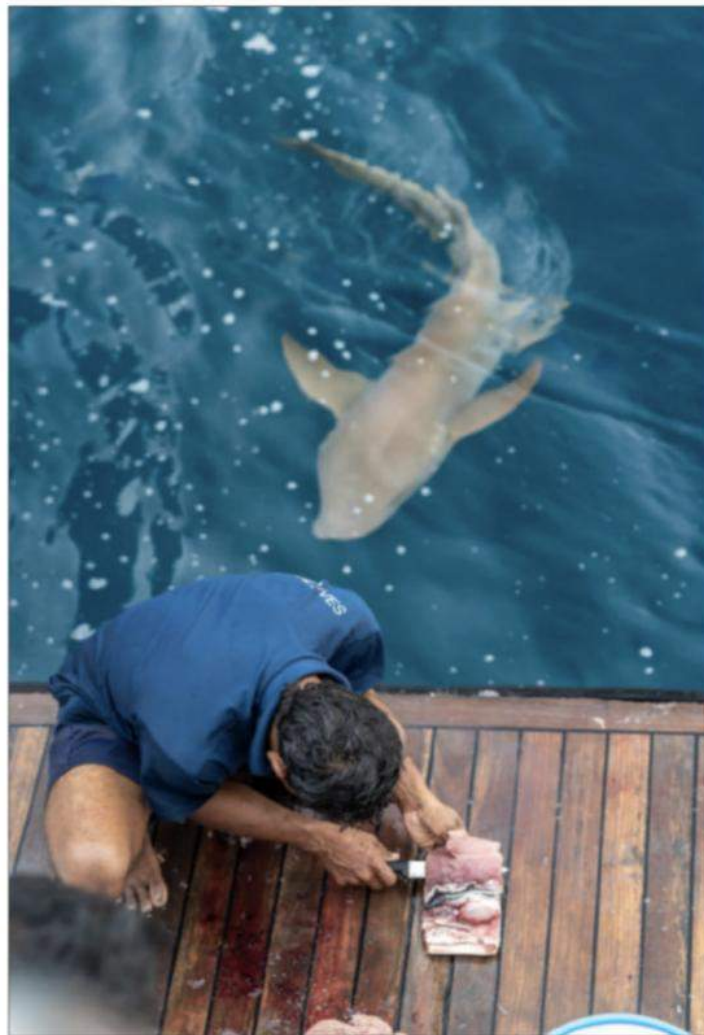
En marlin fileteres, mens en nursehaj i baggrunden er klar til resterne.

på Maldiverne er kun imponerende 2,4 meter over havets overflade.