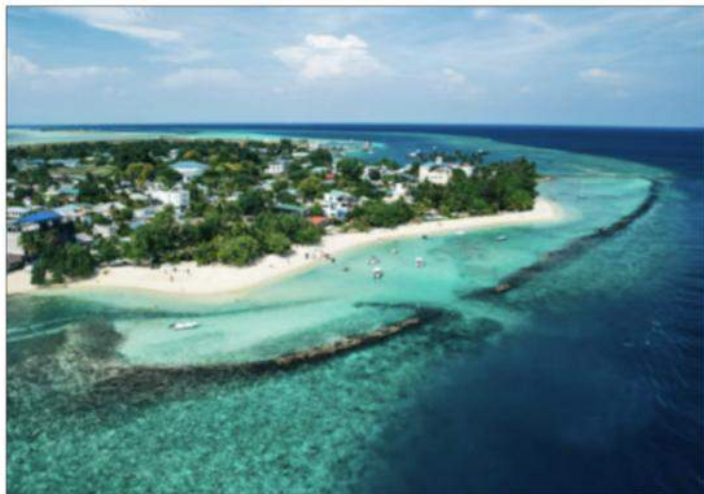
Øen Thulusdhoo, som er en del af North Malé Atolls.