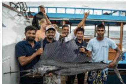
Køkken-crewet viser stolt deres marlin-fangst frem.