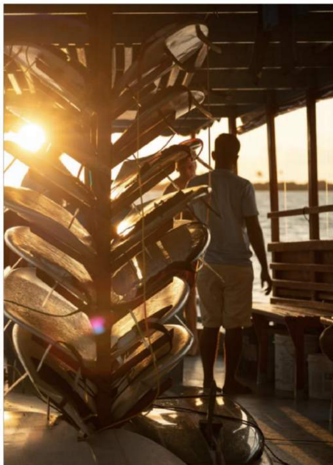
Vores surfboards bliver opmagasineret på dhony-følgebåden.